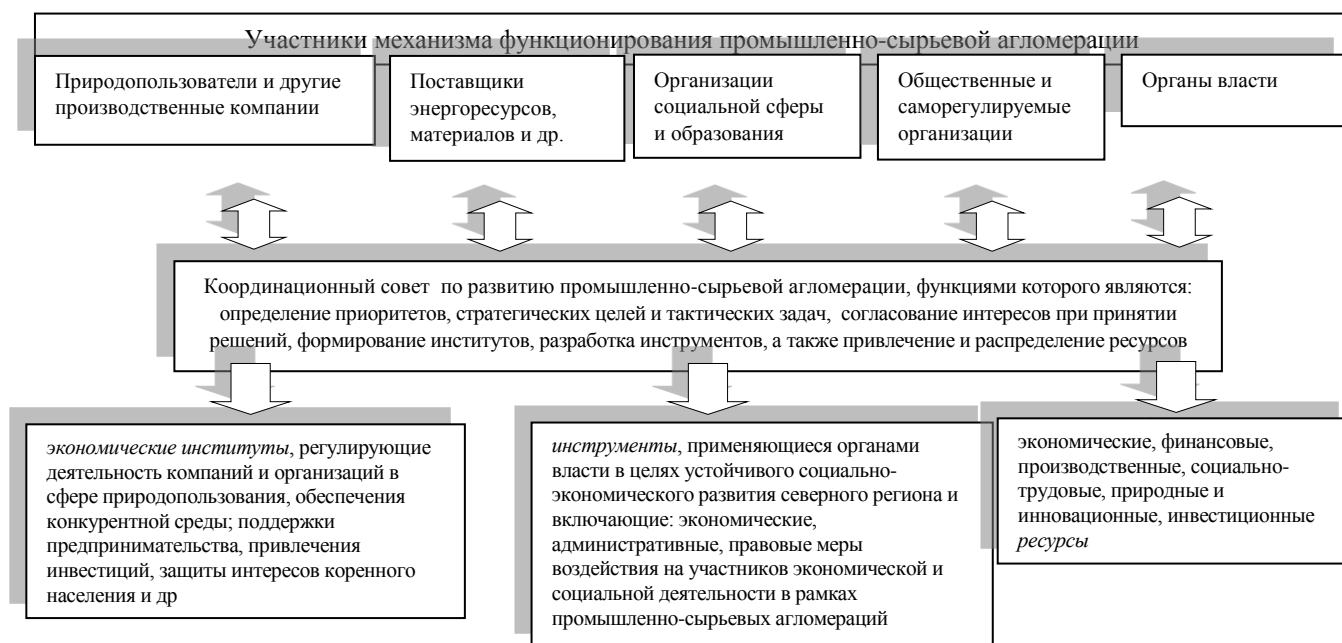
Рис.1 Организационная схема функционирования промышленно-сырьевой агломерации

Анализ и обобщение практики и состояния исследований форм освоения северных территорий позволил авторам сформулировать следующие недостатки: