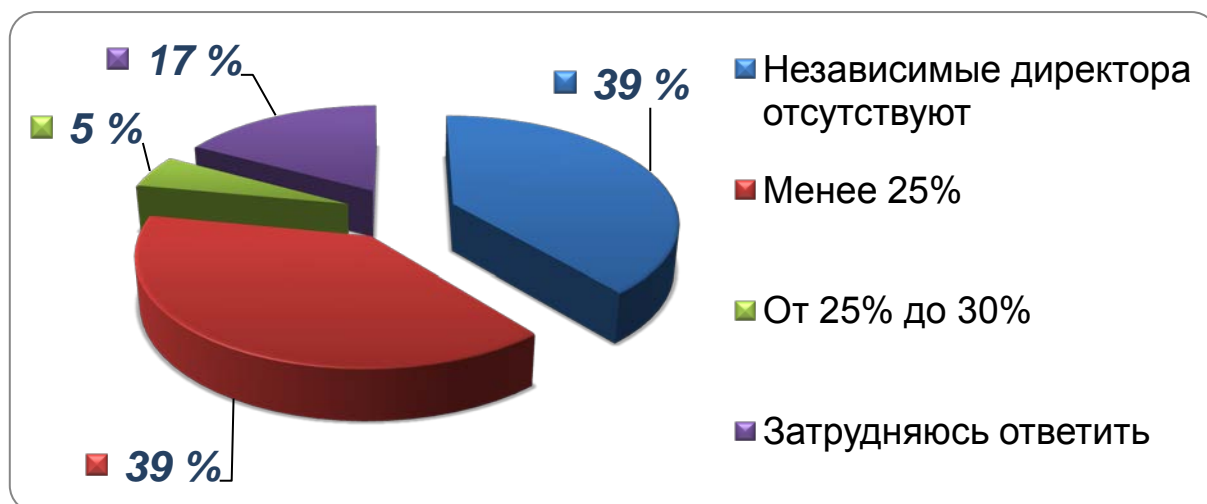
Рис. 1. Доля независимых директоров в составе Совета директоров.

В 2013 году Научно-исследовательский центр корпоративного права управления и венчурного инвестирования Сыктывкарского государственного университета провел исследование среди 90 промышленных предприятий Республики Коми с целью определения уровня корпоративного управления.