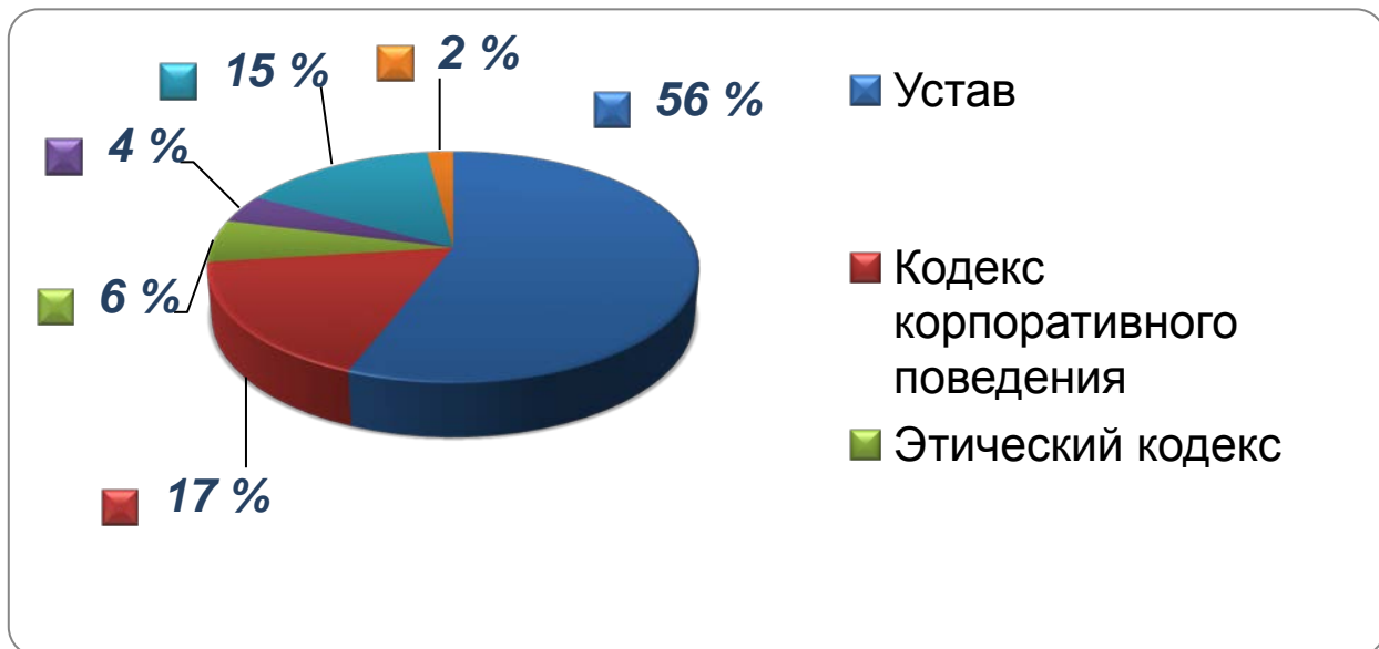
Рис. 3. Документ, закрепляющий стандарты корпоративного управления в организации.

У 55% предприятий Республики Коми фактически отсутствует надлежащая система управления рисками, отсутствует единый орган ответственный за управление рисками в компании.