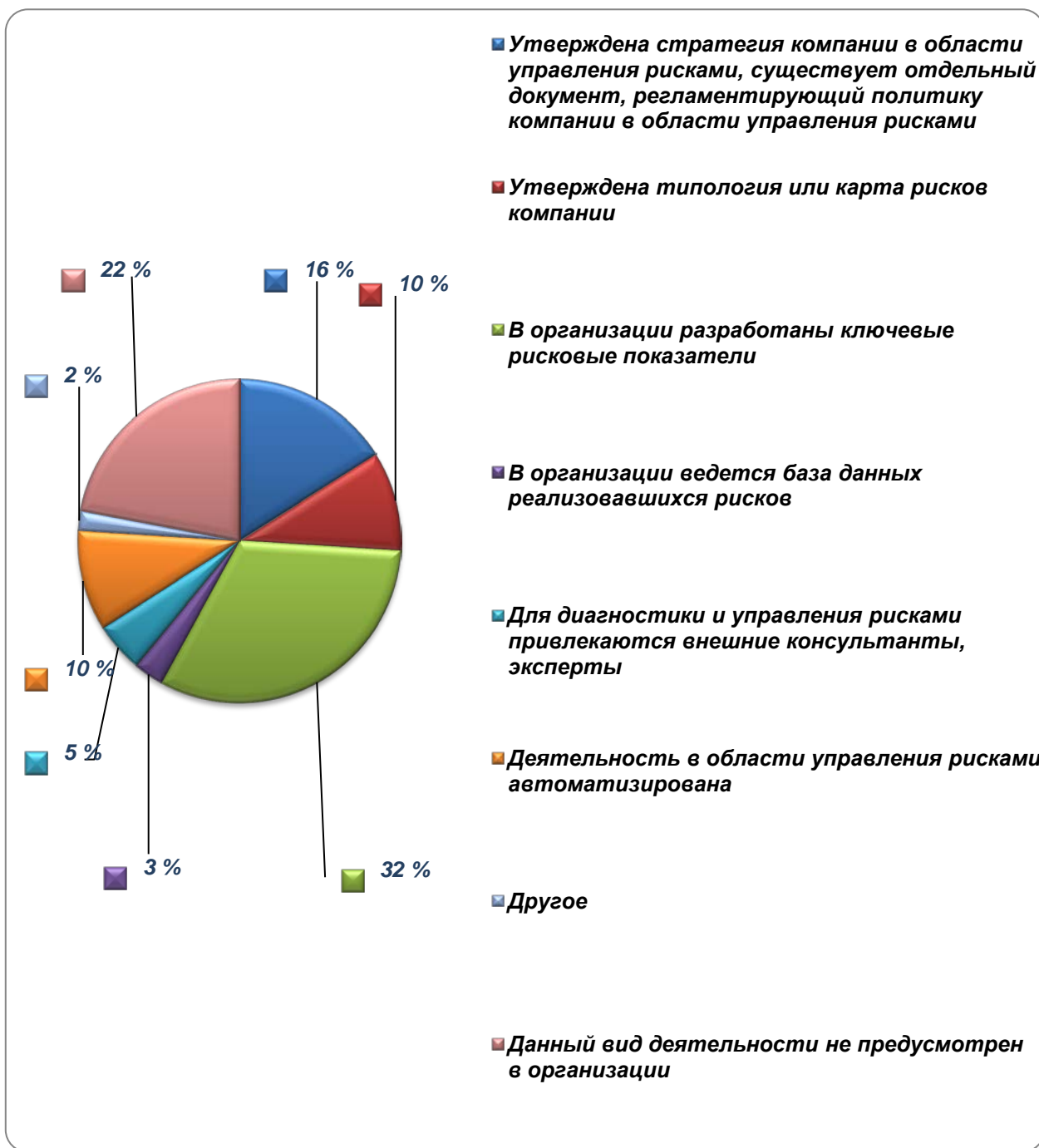
Рис. 4. Элементы в области управления рисками, которые присутствуют в организации.

Только 17% предприятий имеют утвержденный Кодекс корпоративного поведения, закрепляющий основные стандарты корпоративного управления в организации.