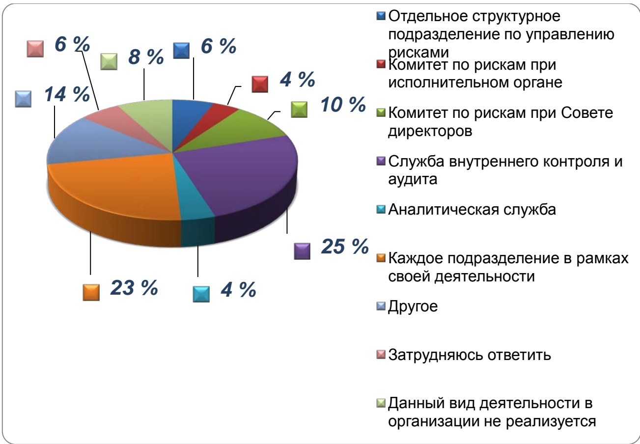
Рис. 2. Структура, которая занимается управлением рисками в организации.

У 55% предприятий Республики Коми фактически отсутствует надлежащая система управления рисками, отсутствует единый орган ответственный за управление рисками в компании.