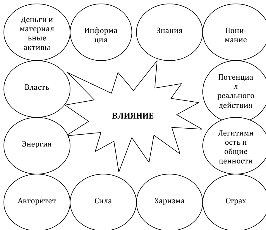
Рис. 1. Концепция влияния как экономическая категория, рассматриваемая в качестве базы маркетинга влияния

Компоненты влияния, как можно видеть из этой схемы и предшествующего анализа, обладают очень высокой степенью взаимосвязанности и взаимообусловленности и с трудом поддаются отдельному, не зависящему от других элементов рассмотрению. Исходя из этого, представляется целесообразным вкратце рассмотреть лишь ключевые связки, определяющие характер, принцип действия и механизм накопления потенциала влияния.