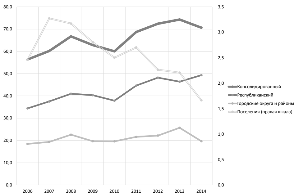
Рис. 2. Динамика расходов бюджетов бюджетной системы Республики Коми за вычетом трансфертов (кроме субвенций) в ценах 2014 г.*, млрд руб.

* скорректировано на годовой индекс потребительских цен