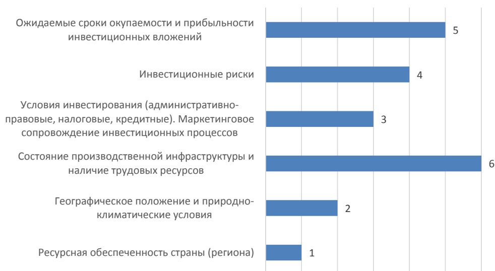
Рис. 3. Ранжирование факторов предложения инвестиций за 2015 г.

Среди факторов предложения инвестиций значимым выявлен фактор ресурсной обеспеченности страны (региона), менее значимым — состояние производственной инфраструктуры и наличие трудовых ресурсов.