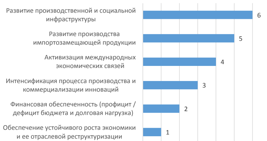
Рис. 2. Ранжирование факторов спроса инвестиций за 2015 г.