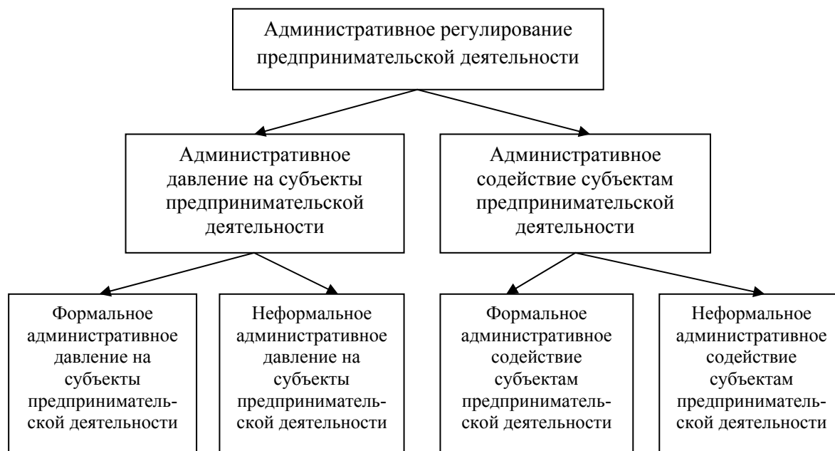
Рис. 1. Схема административного регулирования предпринимательства

Вторая особенность нашего подхода заключается в выделении в обоих видах административного воздействия формальной и неформальной компоненты, что позволяет производить оценку совокупного влияния формальных и неформальных институтов на развитие деятельности экономических агентов предпринимательской среды региона (рис. 1).