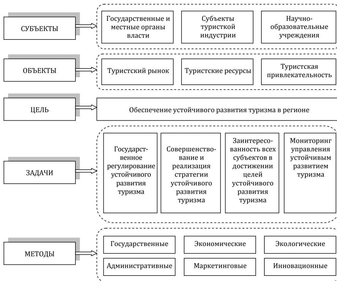
Рис. 3. Механизм управления устойчивым развитием туризма в регионе

Для эффективного управления устойчивым развитием туризма на региональном уровне необходимым видится кластерное сотрудничество органов государственной и местной власти, туристских предприятий и субъектов туристской инфраструктуры, научно-образовательных учреждений. Кластер представляет собой группу взаимосвязанных и взаимодействующих между собой предприятий, организаций и учреждений, целью которых является достижение определенного социально-экономического эффекта, реализующих конкурентные преимущества территории, на которой они функционируют. Схематически механизм управления устойчивым развитием туризма на региональном уровне приведен на рис. 3.