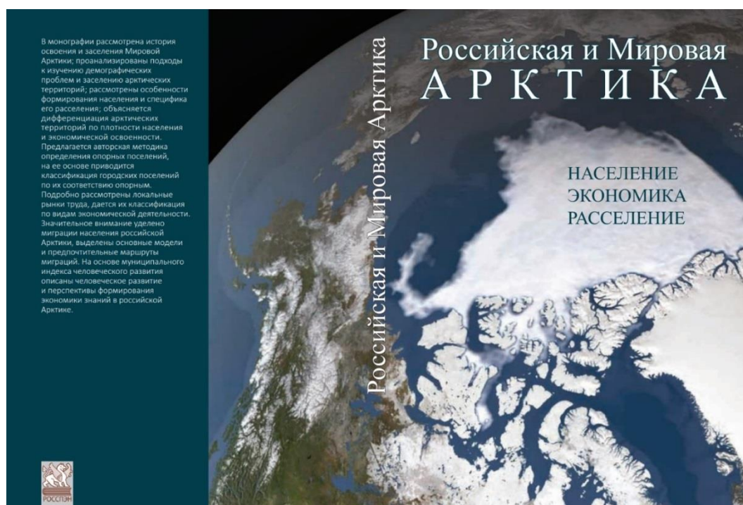
Рис. Обложка монографии

В московском издательстве Политическая энциклопедия (РОССПЭН) вышла в свет монография: Российская и Мировая Арктика: население, экономика, расселение / В. В. Фаузер, А. В. Смирнов, Т. С. Лыткина, Г. Н. Фаузер; отв. ред. проф. В. В. Фаузер. М.: Политическая энциклопедия, 2022. 215 с. ISBN 978-5-8243-2479-2.