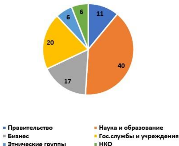
Рис. 3. Соотношение основных групп акторов приграничного сотрудничества в рамках двух программных периодов ППС «Коларктик», в процентах

Трансграничная территория в исследуемых границах программного региона ППС «Коларктик» характеризуется наличием большого числа образовательных и научных учреждений, имеющих высокий авторитет в международном сообществе. Также стоит отметить, что более успешное и интенсивное международное взаимодействие между ними поддерживается такими сетевыми структурами, как, например, Университет Арктики (UArctic). Сложившаяся ситуация указывает на высокий уровень развитости научной дипломатии в Мурманской области, действующими участниками которой являются Федеральный исследовательский центр «Кольский научный центр РАН» и высшие учебные заведения. Активное взаимодействие научных институтов в международном сотрудничестве играет важную роль в развитии и поддержке многосторонних и двусторонних отношений между странами, являясь одной из основ парадипломатической деятельности регионов и государств, институтом «мягкой силы» ( softpower ), а также, активно влияя на эндогенные процессы регионального уровня и стимулируя саморазвитие местных сообществ. В данном контексте следует говорить о научной дипломатии (sciencediplomacy) – сравнительно новой области знаний, которая получила более масштабное развитие в последнее время как в зарубежном [19; 20; 21], так и в российском научном дискурсе [22; 23; 24].