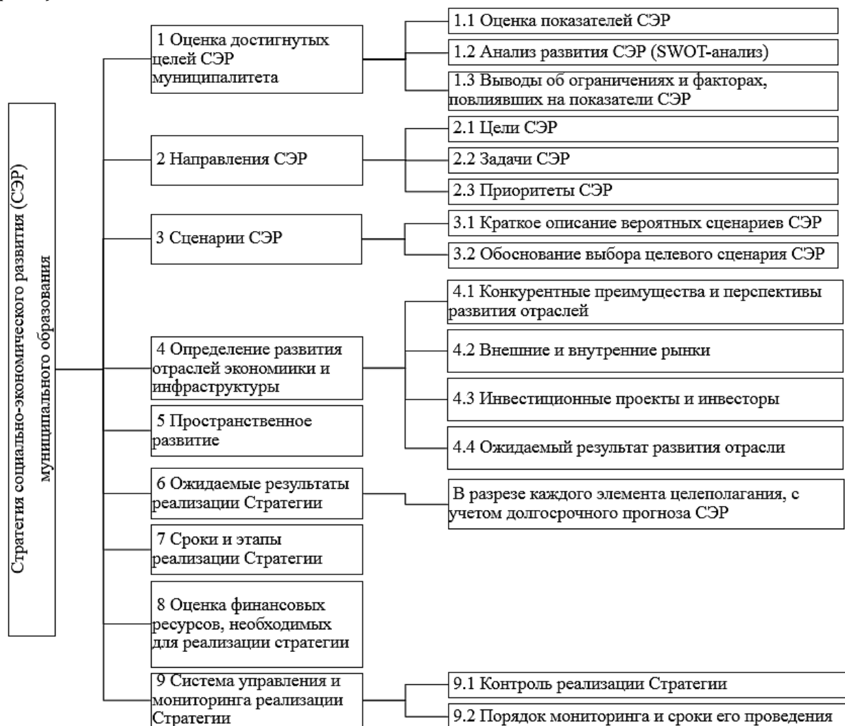
Рис. 2. Структура стратегии социально-экономического развития согласно распоряжению № 14 города Архангельска от 2017 г.

На основании распоряжения об утверждении методики стратегического планирования [25] сформирована структура стратегии социально-экономического развития (СЭР) муниципального образования (рис. 2).