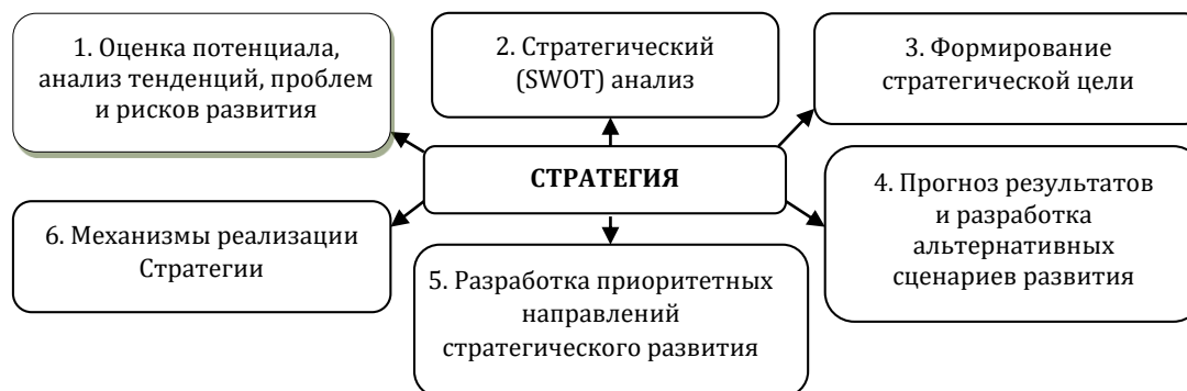
Рис. 1. Этапы формирования Стратегий социально-экономического развития сельских территорий и аграрного сектора

Методические подходы к подготовке стратегий развития сельских территорий и аграрного сектора включают следующие этапы (рис. 1).