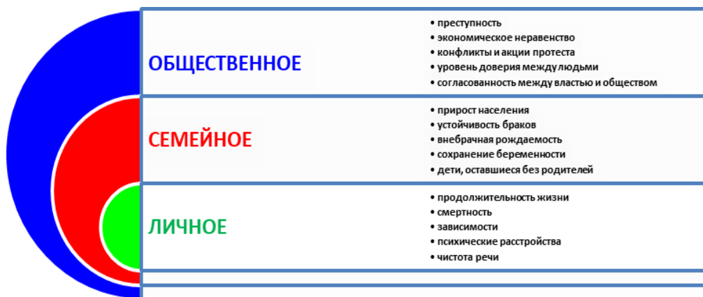
Рис. 1. Индикаторы духовно-нравственного благополучия человека

Первая: в перечне целевых показателей под номером один по-прежнему стоит валовой региональный продукт на душу населения, про который уже давно замечено, что он отражает всё, кроме подлинных человеческих ценностей — любви, честности, красоты, мудрости, отваги, радости, сострадания и тому подобных. Два других показателя — численность населения и продолжительность жизни — более «человечны», но всё же характеризуют не качественную, а количественную сторону жизни.