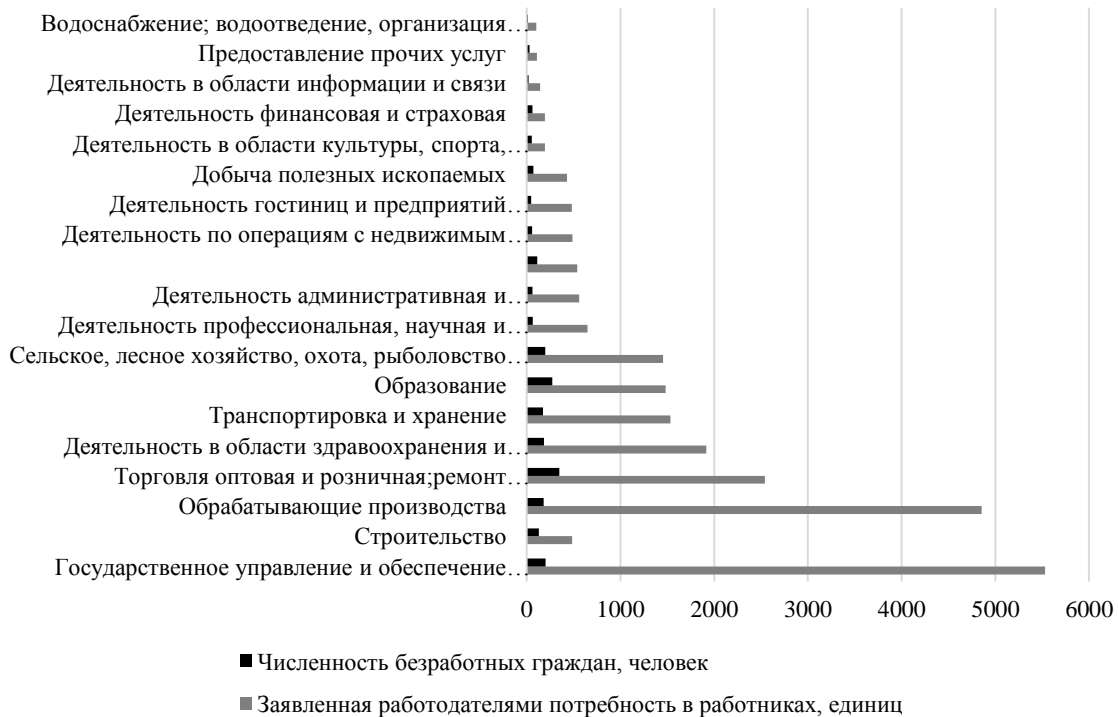
Рис. 2 Вакансии и численность безработных по отраслям экономики Хабаровского края на конец 2023 г.